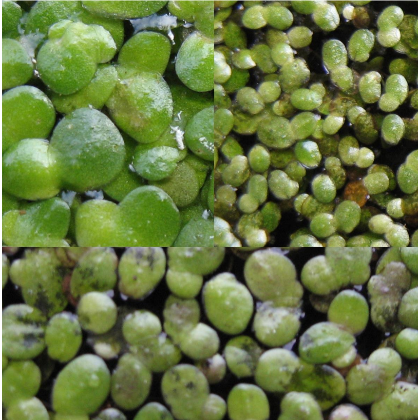
Foto 3: Deze foto toont het verschil in grootte. Links-boven Klein kroos, Rechts-boven Dwergkroos en onder Knopkroos. Bultkroos staat niet op deze foto, maar is nog groter dan Klein kroos.

Omdat Knopkroos vrij nieuw is voor Nederland zou ik graag willen weten waar Knopkroos in onze regio voorkomt. Daarom wil ik iedereen oproepen eens beter naar Eendenkroos te kijken. Mocht je Knopkroos vinden noteer dan de coördinaten, vinder en datum.