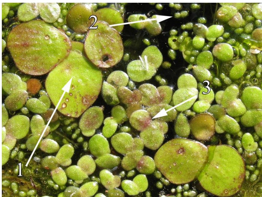
Foto 1: Verhoudingen tussen de verschillende soorten: hierbij is 1 Veelwortelig kroos, 2 Wortelloos kroos en 3 Knopkroos.

Omdat Veelwortelig kroos, Puntkroos en Wortelloos kroos nauwelijks te verwarren zijn met de andere eendenkroos ga ik er in dit artikel niet diep op in.